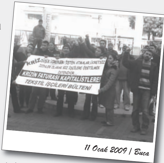
11 Ocak 2009 | Buca

Begos, MTK ve Gıda Çarşısından tekstil işçileri